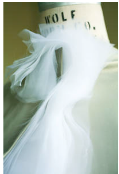
Living Pod, 2008 (2 interaktive Mäntel, Leder, hochwertiger Organza, Elektronik-Komponenten)

„Live Pod“ liefert dafür ein schönes Beispiel, denn der Mantel, der nach kurzer Reparatur schon wieder funktioniert, ist nur der eine Teil der Installation. Ihm gegenüber steht ein zweiter Mantel, als eine Art parodistisches alter ego: beginnt das eine Kleidungsstück sich aufgrund von Lichteinstrahlung langsam zu pfauenhaften Posen und Formen aufzuspreizen, folgt ihm das andere zeitversetzt in der gleichen Choreografie von Stoff und Falten, und steigert diese schließlich zur Groteske, bevor es sich wieder in seine Hülle zurückzieht. Schöner lässt sich das von Hype und Missverständnissen, Umdeutungen und Marktzwängen geprägte Verhältnis zwischen Haute Couture und H&M-Style kaum in Szene setzen.