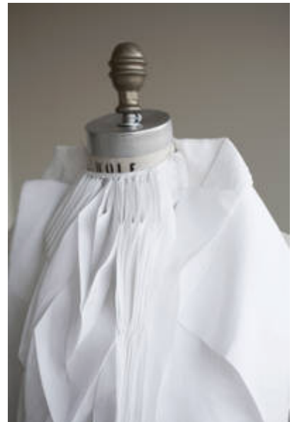
Walking City, 2006 (2 interaktive Kleider, Baumwolle, Elektronik_Komponenten)