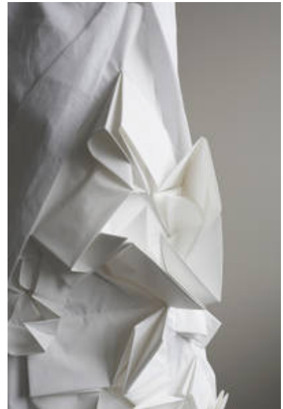
Walking City, 2006 (2 interaktive Kleider, Baumwolle, Elektronik_Komponenten)