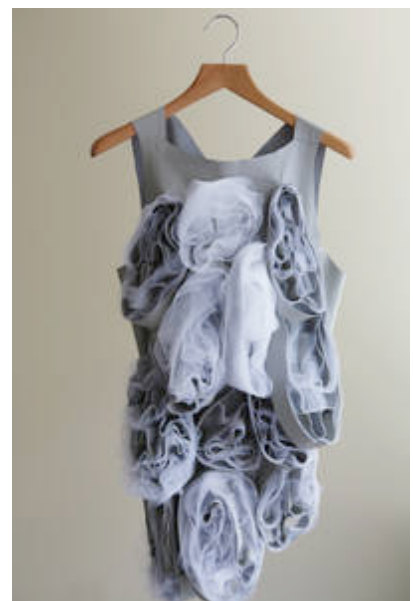
Living Pod, 2008 (2 interaktive Mäntel, Leder, hochwertiger Organza, Elektronik-Komponenten), Foto: Dominique Lafond